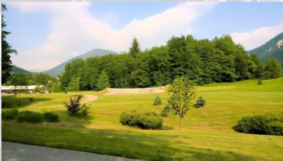
IL PARCO FLUVIALE RIO OFSA

La chiesa di San Biagio, la chiesetta di San Rocco nella frazione Casetta, la cascata del Pison, il Tiglio Secolare di Maso Weiss, La strada dei Castagni in località Lastra Castrozze e il "Trodo delle Fiabe", un tratto di sentiero che attraversa il bosco, dove vengono svolti laboratori creativi e letture animate, costellato di personaggi delle favole fatti in materiale naturale.